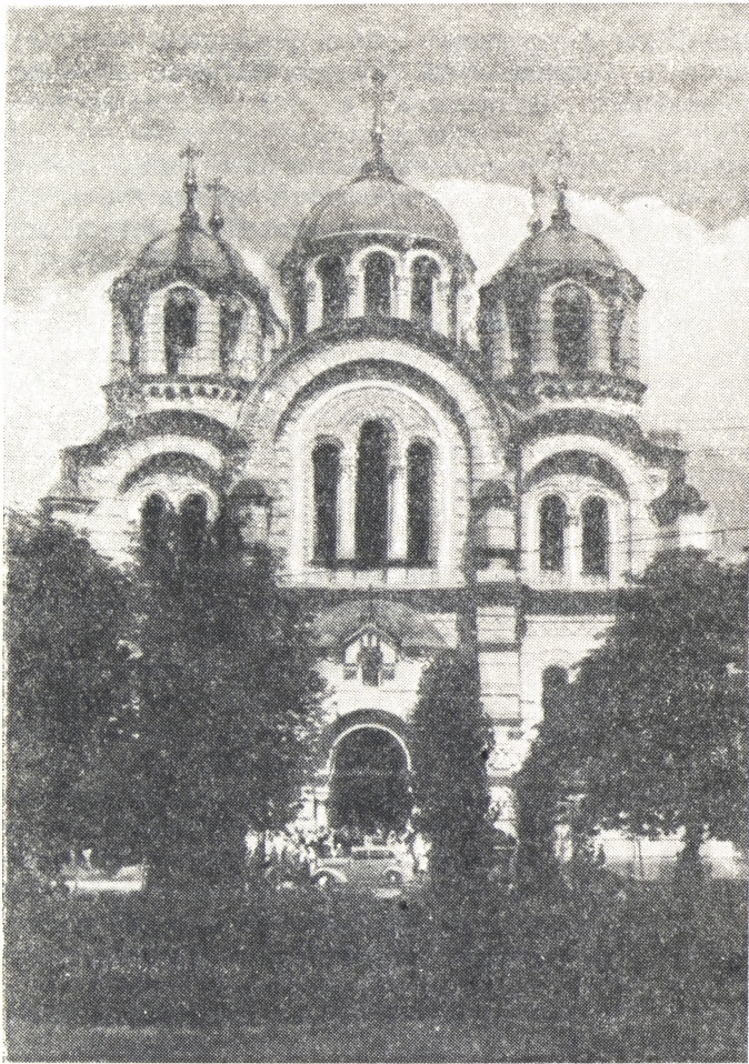
ВЛАДИМИРСКИЙ СОБОР В КИЕВЕ

Праздник своего просветителя, св. равноапостольного Владимира, Киев встречает во всем великолепии своего красочного цветного убранства.